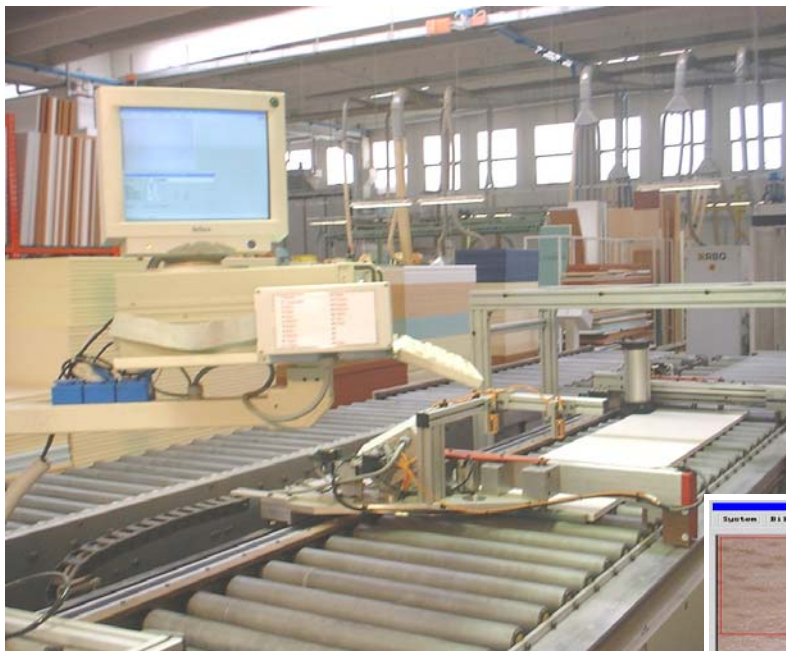
WOODchecker in der Möbelplatten-Produktion (oben) Bildschirmdarstellung der Maserungs-Erkennung (rechts)