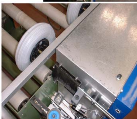
EDGEchecker an der Kanten-Maschine (oben) Ink-Jet-Einheit zur Fehler-Markierung (links)