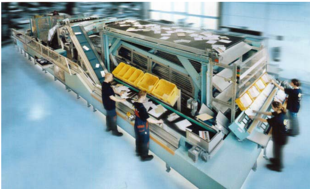
STAMPchecker im Einsatz bei der automatischen Großbrief-Frankierung

Der STAMPchecker ist ein innovatives Erkennungssystem für Briefmarken auf beliebigen Brief-Formaten mit integrierter automatischer Stempelaufbringung.